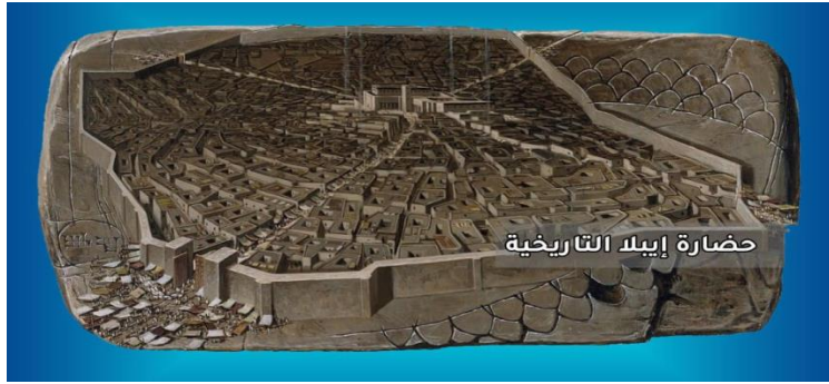
الشكل 5 مدينة إبلا (تل مردوخ)