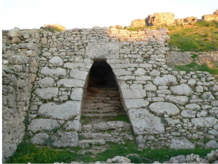
الشكل 6 البوابة الغربية في أوجاريت (رأس الشمرة)

معلومات التمويل : هذا البحث ممول من جامعة دمشق وفق رقم التمويل (501100020595).