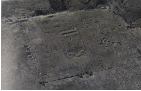
(الشكل 1) صورة جوية يتضح من خلالها مخطط و امتداد الكاتدرائية في موقع النبي هوري.

استخدمت هذه التقنية في سورية منذ عشرينيات القرن الماضي من قبل الأب بوادبارد A. POIDEBARD وذلك عند دراسته خطوط الدفاع الرومانية والمسالك القديمة في بادية الشام والمرافئ القديمة 1 . في عدة مواقع أثرية، ولم يقتصر استخدامها من أجل التحري والكشف عن ماهية وجود موقع أثري في منطقة ما، بل استخدم كذلك من أجل إعطاء صورة كاملة لمشهد العمل الميداني بعد الإنجاز وذلك بغية توثيق أعمال الحفريات خصوصا اذا كان الموقع الأثري قريب من مجرى مائي، وخير مثال على ذلك موقع تل بيدر الواقع على بعد 15 كم شمال مدينة الحسكة 2 . كذلك استخدمت تقنية التصوير الجوي في موقع سيروس النبي هوري 3 ، ومن خلال الصورة تبين تحديد الرسم الهندسي لمبنى الكاتدرائية والتخطيط العام للموقع الأثري (الشكل 1).