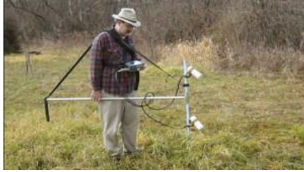
الشكل 3: صورة جهاز المسح المغناطيسي 1 الذي اعتمد في مسح تل الشعيرات.

في أماكنها المناسبة على شكل أوتاد من الخشب تبعد كل نقطة عن الأخرى 100م طول وعرض بشكل شبكة تعطى أحرفاً بحسب الترتيب الأبجدي، ومن ثم كل مئة متر تقسم بالأوتاد الخشبية لقسمين 50 م ليسهل تقسيمها إلى مسارات متساوية البعد من أجل السير في خطوط مستقيمة، ومن ثم المشي والجهاز مثبت و محمول على الخصر لمسافة 50 م ذهاباً وإياباً، بعد القيام بتنظيف كامل المنطقة المراد مسحها من قطع الحديد التي تعيق عمل الجهاز بحيث لا يستطيع الجهاز بكشف الطبقة التي تحتها. وعند الانتهاء يتم إفراغ المعلومات المسجلة على الجهاز، على الكمبيوتر ليتم قراءتها. أعطى المسح المغناطيسي نتائج جيدة فقد أظهرت النتائج المعالجة من الجهاز وجود طرق رئيسية وأخرى فرعية، كذلك وجود بيوت صغيرة وكبيرة منتشرة في الجزء الممسوح. وتم تأكيد هذه النتائج من خلال إجراء عدة أسبار اختبارية حيث أظهرت بعض الجدران وبعض اللقي الفخارية.