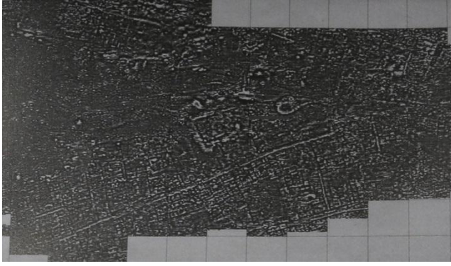
(الشكل 5) مخطط المسح الجيوفيزيائي، يوضح امتداد المدينة الهلنستية، تدمر، تاريخ سورية