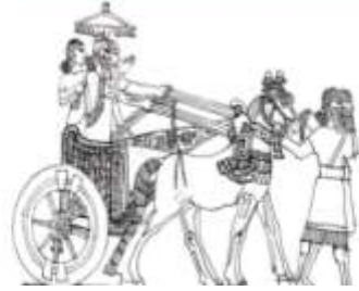
الشكل (7) إسماعيل، 2018م، 663.

وفي مدينة دور شروكين(خرسباد) 1 وجدت منحوتة تصور الملك شروكين الثاني على عربة ملكية، ويحمل بيده اليسرى القوس،