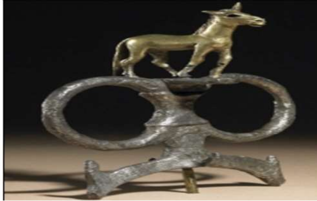
الشكل (6): جزء من الشكيمة المتصلة بالجام عبر الحلقات