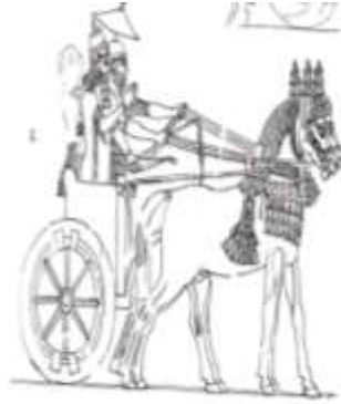
الشكل (8) إسماعيل ، 2018م ، 664

ورافعاً يده اليمنى، وخلفه شخص يحمل مظلة.(الشكل 8)