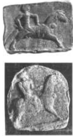
الشكل (1) رسومات الخيل على الطين في فترة الألف الثالث ق.م.

الملكية 1 ، مما أدى إلى اختلاف الباحثون حول الموطن الأصلي لتدجين الحصان، وربما يكون تدجين قد بدأ في سهول أوكرانيا (Berger, Protscher, 1973,222). كان الحصان معروفاً عند السكان المناطق المجاورة لبلاد الرافدين، وخاصة في مناطق الأناضول الشرقية والشمال الشرقي منها في بداية 3000ق.م، ويُعتقد أيضاً أنه كان معروفاً في منطقة سوسة 2 في 2400ق.م في بلاد عيلام، وكانت هناك علاقات تجارية تربط بلاد الرافدين مع المناطق الشرقية (بلاد عيلام) مما ساهم في ظهور الحصان في بلاد الرافدين منذ عهد سلالة أور الثالثة، حيث ظهرت المصطلحات الفنية التي تدل على ذلك فضلاً عن المصطلحات اللغوية التي تؤكد تدجين الحصان (Zarins.,1978, 4-5) (الشكل 1)، ووقد ورد ذكر الخيل في عهد الملك جوديا (2144-2124ق.م) 3 ،