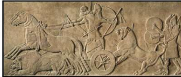
الشكل (2) البياتي، د، ت، 184.

عندما كانت الذبائح المضحاة تنظم في اهتمام، وقد حدد جوديا عدد الأسماك والثيران والنعاج والحملان والخيل التي يضحي بها في معابد لاجاش باسم المدينة لمناسبة أعياد السنة المهمة (دوبلابوت، 1997م، 146) ورد اسم الخيل في النصوص المسمارية بالصيغة (ANSE-KUR,RA) وبالأكادية (Sisu) (AHW, P.1250)، ويعني ذلك حمار الجبال (Nejat, K,R,N,2000,251)، مما يؤكد أنه لم يكن حيواناً محلياً، بل حيواناً أجنبياً تم جلبه من مناطق التي تقع خلف السلاسل الجبلية المحيطة ببلاد الرافدين، وحسب المعلومات المتوفرة التي تشير إلى أن الحصان قد تمت عملية تدجينه، واهتمام بتربيته منذ عهد سلالة أور الثالثة حيث ورد ذكر الحصان في ترتيلة الملك شولجي 1 حيث وصف نفسه بصفات الحصان (( أنا الحصان الذي يتموج ذيله في الطريق)) (سعيد، 2008م، 35)