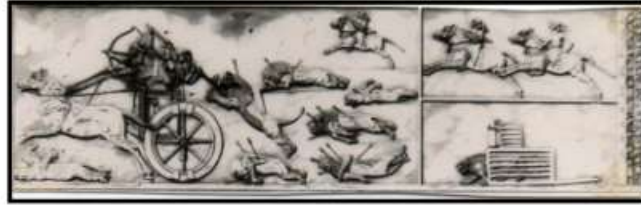
الشكل (3) الطائي، 2013م، 490.

إلى رابطة العنق، ووظيفته تخفيف الحمل على الخيول في حالة جر العربات، ويوضع على الخيول في الاحتفالات ورحلات الصيد بهدف التفاخر والزينة، والحلي كانت عبارة عن أشرطة من القماش وتتألف من اللونين الأحمر والأزرق، وذلك التناوب تشمل حلي الرأس والصدر، وهذه الزينة كانت تصنع من القماش أو المعدن المغطى بالقماش التي تضيف للخيل جمالاً (محمد، 2018م، 152). كما كان يتم تغطية أجساد الخيول بأغطية تحميها من الضربات أثناء المعارك، ومن أجواء الطقس البارد كما بدا ذلك واضحاً في مشاهد الخيول التي تسحب عربات الملك الآشوري آشورناصربال الثاني (883-859 ق.م) 1 ، ولدينا مشهد تظهر الملك آشور ناصر بال ركباً عربته، ومن عليها يقتل الأسود بوساطة قوسه، ومعه أربعة أشخاص اثنان منهم من حملة الرماح الشكل (3).