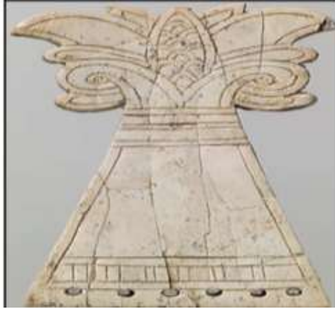
الشكل (4) محمد، 2018م، 133

زخارف بين الهندسية والنباتية والمجسمة، حيث عُثِر في مدينة النمرود بأحد مخازن الجزية للملك آشور ناصر بال الثاني غرفة (SW-37) قطعة رقم (ND9376) تتضمن زخارفها براعم الزهور وأوراق النباتات (محمد، 2018م، 132) (الشكل 4)،