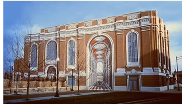
الشكل (5) ريتشارد هاس، واجهة أحد الأبنية، أمريكا. 11

أما الفنان الأمريكي ريتشارد هاس فقد استخدم التصوير الجداري لخدمة الخداع البصري في الفراغات الداخلية والخارجية بإضافة رسومات تعطي بعداً ثالثاً للجدار والسقف، فشكل حركة حيوية ديناميكية داخل الفراغات الداخلية وأعطى طرازاً معمارياً جديداً للواجهات الخارجية، الشكل (5-6).