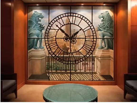
الشكل (6) ريتشارد هاس، جدار داخلي، أمريكا. 12

ثانياً: التقنيات والمواد المستخدمة في اللوحة الجدارية: يحدد الفنان المادة المراد العمل بها لتشكيل اللوحة الجدارية مع مراعاة مفهوم الديمومة في الصفات الفيزيائية والكيميائية للمادة المستخدمة، ولذلك كان استخدام أنواع المواد من: "الفريسك، التمبرا، الفسيفساء، التصوير بالشمع، تقنيات الزجاج، التصوير الزيتي، التصوير بالأكرليك، التشكيل بالخشب، الاسجافيتو، الخزف، المعلقات النسيجية والتقنيات الحديثة" 13 ، يعطي الفنان مقدرة على التشكيل الأنسب للوحة الجدارية، وسنتكلم عن بعض هذه المواد: