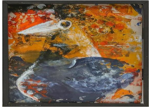
الشكل (8) كاي ويتكومب، لوحة الطيور، مينا على فولاد، 1971

من طليها بمادة الورنيش التي تعطي طبقة عازلة وتحميها من التغيرات المناخية للعالم الخارجي. المينا الحرارية: إن كلمة مينا مشتقة من "كلمة melt أو إذابة، لأن المينا الحقيقية عبارة عن طلاء زجاجي يتم صهره في أفران في درجات حرارة عالية جداً" 19 ، تصل إلى 900 درجة مئوية، وهي مادة تتكون من طبقة زجاجية من السيليكا والأكاسيد الملونة الملتصقة على الأسطح المعدنية، تعد المينا الحرارية من المواد الحديثة في التصوير الجداري والتي تم استخدامها لمقاومتها القوية تجاه العوامل الجوية، فاستخدمت في الفضاءات الخارجية لعدم تأثرها بعوامل التعرية والظروف المناخية المختلفة، إضافة إلى أنها مادة صلبة لا تتغير خواصها وألوانها ذات الدرجات المختلفة والكثيرة يمكن تطويعها وتشكيلها بسهولة على السطح المعدني، ولكنها تحتاج إلى أفران للشوي، ومن الفنانين الذين ابدعوا في التصوير باستخدام المينا الحرارية الفنانة كاي ويتكومب 20 ، التي لها لوحات كثيرة ذات مواضيع مختلفة مطبوعة بالمينا، الشكل (8).