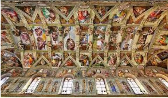
الشكل (1) مايكل أنجلو، سقف كنيسة السكستين، ألوان مع الجص الرطب على جدار، 1508-1512 م. 6

شكلت اللوحات الجدارية للنحات والمعماري مايكل أنجلو Michelangelo Buonarroti التي قدمها في كنيسة السكستين، مجموعة كبيرة من الرسوم الجدارية ذات المواضيع الدينية على سقف الكنيسة، يفصلها بعضها عن بعض رسم "إطاراً معمارياً لربطها بالعمارة الحقيقية للكنيسة مثل الهالات والمنحنيات والأعمدة" 5 ، الشكل (1).