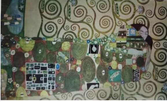
الشكل (3) كليمت، لوحة جدارية، مواد مختلة على جدار، 1905-1906 م. 9

أكد الفنان المكسيكي دافيد ألفارو سيكيروس • David Alfaro Siqueiros على الخروج إلى الشارع لإغناء الفكر الاجتماعي، كانت المدرسة الإعدادية الوطنية أول مختبر لأعماله الجدارية الجماهيرية، فاختار جدران الدرج، وصور فيه العناصر الثلاثة: النار والهواء والماء، بالإضافة إلى رسمه مسيرة الإنسانية في أمريكا اللاتينية، الشكل (4)، إذ عبر سيكيروس فيها عن موقفه من الحياة، فدمج الطبيعة مع المأساة البشرية، برسم شخصيات إنسانية محملة بلامح ثورية ضد الألم والظلم، وأبعاداً اجتماعية وسياسية تؤكد على ضرورة النضال للوصول إلى المجتمع السامي.