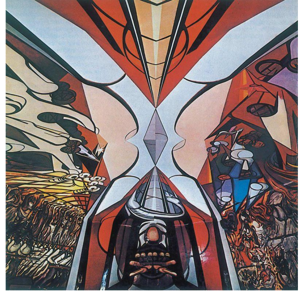
الشكل (4) سيكويروس، مسيرة الإنسانية، مواد مختلفة على جدار، 1971 م. 10

تأثير اللوحة الجدارية على الفضاءات الداخلية والخارجية