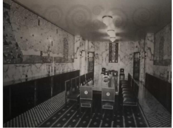
الشكل (2) جوزيف هوفمان، لوحات جدارية في غرفة الطعام ، بروكسل، 1905م. 8

استخدم كليمت (Klimt) فسيفساء الزخرفة المسطحة على جدار غرفة الطعام في المنزل المصمم من قبل جوزيف هوفمان عام 1905 م الذي صممه وفق "النمط الجديد بخطوطه المستقيمة" 7 ، فأكد كليمت على الوظيفة الفخمة للمنزل، بإدخال المنحنيات الزخرفية والتلاعب بنسب القوالب والمواد الدقيقة لإعطاء التنوع والحيوية للفراغ الداخلي، وإضافة مواد وصباغ لونية مبددة للصوت لإعطاء الراحة في غرفة الطعام وتخفيف الصدى الناتج عن صوت الملاعق والصحون، الشكل (2-3).