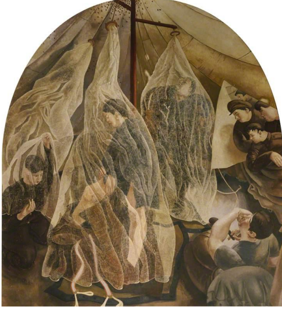
الشكل (7) ستانلي سبنسر، لوحة جدارية في ريفيل، مادة التنفيذ التمبرا، 1927-1932 م، 17

ألواح مثبتة من القماش المعالج أو الجداريات الجصية، وقد استخدمت هذه التقنية في القرن العشرين كاللوحات الدينية الرمزية الضخمة التي أنجزها الفنان ستانلي سبنسر 16 . الشكل (7).