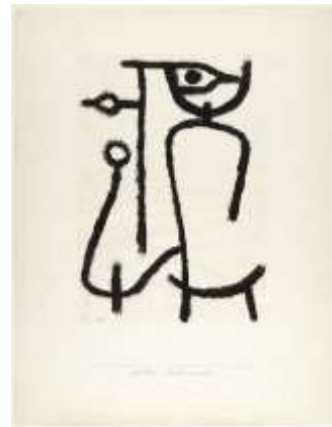
الشكل (15) بول كلي- سيدة - - شاشة حريرية. 1940-50.2/64.8سم

لقد كان (كلي) خير من استغل طاقة الخط بأقصى درجات التبسيط والتحوير والاختزال لمشاهد عالمه الحالم القائم على الفكر الحدائوي في الخلق المتجدد. إن "أهمية التنوع الخطي في العمل.... في البداية نوع بدئي بديهي من الفن ولكن بعد ذلك تم تقريبه وإثرائه وتطوره إلى فن روحي" (paul و klee، 1969، صفحة 454) مبرزاً بدائياته المعاصرة المتحررة من كل القيود وقد رسمها بكل حرية متجاوزاً الزمان والمكان ضمن عالم