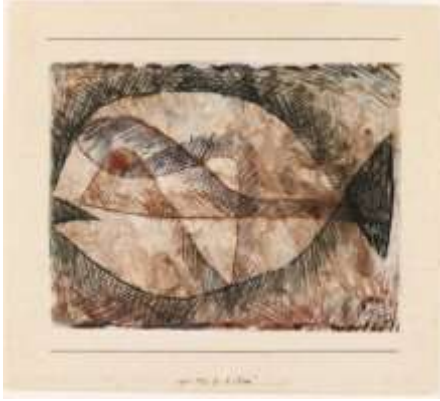
الشكل (1) بول كلي- سمكة- ألوان مائة+ حبر 1931 سمات وخصائص النزعة البدائية وعلاقتها بالفن الطفولي: