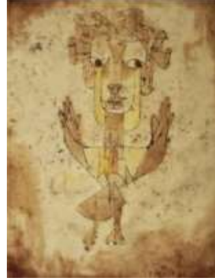
الشكل (4) بول كلي - مونوبونت. 1920

(وورينغر) "يجب الاعتراف أن الفن المعاصر هو فن ذاتي صرف" (التريكي، ب،ت)، صفحة 75). شكل (4)