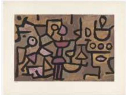
الشكل (17) بول كلي- يوم موسيقي - - ألوان زيتية. 1940-52.4/35سم

لقد كان (كلي) خير من استغل طاقة الخط بأقصى درجات التبسيط والتحوير والاختزال لمشاهد عالمه الحالم القائم على الفكر الحدائوي في الخلق المتجدد. إن "أهمية التنوع الخطي في العمل.... في البداية نوع بدئي بديهي من الفن ولكن بعد ذلك تم تقريبه وإثرائه وتطوره إلى فن روحي" (paul و klee، 1969، صفحة 454) مبرزاً بدائياته المعاصرة المتحررة من كل القيود وقد رسمها بكل حرية متجاوزاً الزمان والمكان ضمن عالم