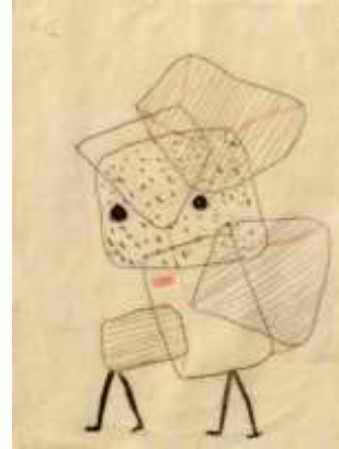
الشكل (14) بول كلي- أطفال محملون - - حفر بالماء القوي1930