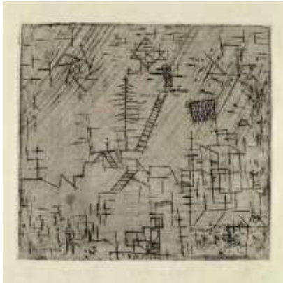
الشكل (7) بول كلي - حفر بالماء القوي - 1928 - 34.7/38.8 سم

الشكل (6) بول كلي - القلعة والشمس - ألوان زيتية - 1928 كل ما سبق كانت مرتكزات هامة في بلورة لغته الجرافيكية القائمة على إدراكه البصري للون ودرجاته ومكنوناته الرمزية البدائية المجردة إلى إيقاعات موسيقية. كل إيقاع لون يستمد من طبيعته الذاتية شكل (6). وأنه لم يتوقف عند التنوع اللوني، بل تمتعت أعماله الجرافيكية بحيوية الشكل لتكويناته البنائية المبسطة ذات المفاهيم التكعيبية كما في الشكل (7-8-9) حيث يظهر دراسة للشكل من الناحية الحدائثية القائم على المشهد المركب لعناصره التكعيبية.