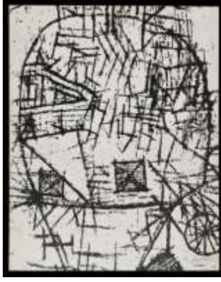
الشكل (11) بول كلي- وخز المهرج- - حفر بالماء القوي. 1931-38/30.1 سم

مبرزاً ذلك بوضوح خاصة بعد انضمامه لمدرسة الباوهاوس (Bauhaus) من عام 1920 حتى عام 1930 ووضعاً فيها المبادئ الأساسية للفن الحديث حيث أعلن "أن مهمة الفن أن يجعل غير المرئي مرئياً" (التركي، (ب،ت)، صفحة 71) مؤكداً على عناصر طبيعته (النقطة- الخط- المساحة) التي وجدت من بداية الخليقة لتشكّل صورته المبسطة المرئية المجردة لرموز دلالاته الروحية لقد أراد التعبير عن دلالة الأشياء الجوهرية الثابتة مؤكداً أن "جميع أشكال التطور تتم لا محالة بحركة حيوية مؤكدة منطلقها القوة البدئية- الفطرة في الجذور، (2018، صفحة 116)" انظر الشكل(12)