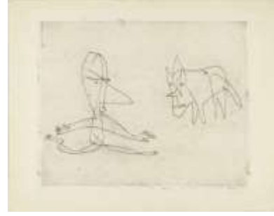
الشكل (13) بول كلي- لماذا يركض - حفر بالماء القوي-1932-29.9/23.8سم

فالعلمية الإبداعية الأكثر ثراء عند كلي أطلقت "على الخط المستقيم للمفهوم الهيكلية النوع الأكثر بدائية من الهيكل التركيبي القائم على الإيقاعات المتكررة وفقاً لذلك لا تفكر بالشكل بل بالتكوين تمسك بالمسار الخطي.....احتفظ بالخط التكويني.....وتمسك بالضرية الإبداعية" (paul و klee، 1969، صفحة 103) انظر الشكل(16)