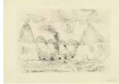
الشكل (18) بول كلي- بواخر قرب لوغانو- ليتوغراف.

سريالي خلق من خط مجرد بدئي ببساطة. لتبدو أسلوبيته عبارة عن حوار خلاق وممزوج بروح الفكر والبحث الدائم بين الواقع والخيال في الوعي واللاوعي إنه الإحساس بالحدائفة والخلق المتجددين بأسلوب متفرد للخط الغرافيكي المبسط، انظر الشكل(17)