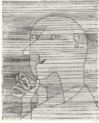
الشكل (20) بول كلي- مسن يعد - حفر بالماء القوي.