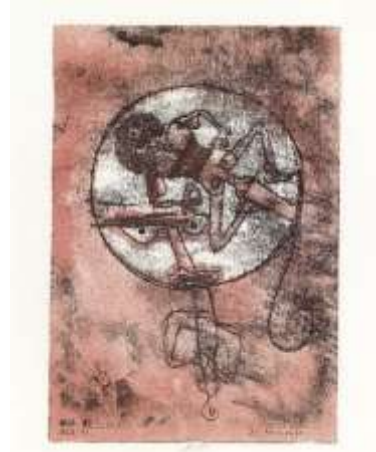
الشكل (19) بول كلي- ليتوغراف- 1923-