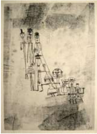
الشكل (21) بول كلي - ليتوغراف 1920.

يدعونا بول كلي بكتابه نظرية التشكيل " أن نودع عالم الأشكال وأن نسافر معه إلى عالم التشكل، بمعنى أنه يريد أن نصل معه إلى منطق الخلق، منطق اكتساب الشكل لملاحه وطبيعته المفردة، فخبيرة التشكيل أهم من الشكل النهائي، ومنطق الخلق أكثر أهمية من شكل المخلوقات، فإن التجربة المفردة أهم من القانون، وهو أيضاً جوهر عمل بول كلي وما سعى إليه طيلة عمره الإبداعي، فإنه يقدم خبرته في كشف العلاقات بين العناصر البصرية التي تكتسب حياتها من طريقة تشكيلها الخاصة بالزمان والمكان." (بول، 2002، صفحة 38)