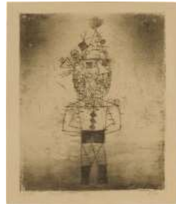
الشكل (10) بول كلي- لدغة المهرج- حفر بالماء القوي. 1931-119.16/91.2 انش

استمر بول كلي بدراسته الفكرية الحداثوية وصولاً إلى مراحل متقدمة للشكل المجرد القائم على الفن البدائي المعتمد على الإبداع الخطي والشكلي في التضخيم والمبالغة لمفرداته الفطرية الذاتية بدلالة الروحية كما في الشكل (10-11).