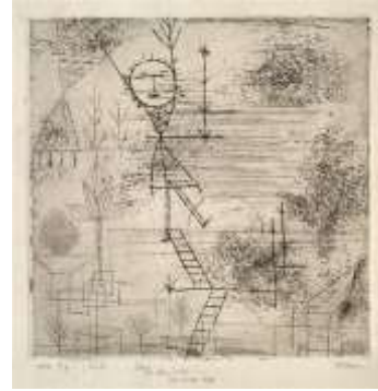
الشكل (9)- بول كلي- الأعالي-ألوان مائية+حبر- 1928-22.3/22.3 سم

استمر بول كلي بدراسته الفكرية الحداثوية وصولاً إلى مراحل متقدمة للشكل المجرد القائم على الفن البدائي المعتمد على الإبداع الخطي والشكلي في التضخيم والمبالغة لمفرداته الفطرية الذاتية بدلالة الروحية كما في الشكل (10-11).