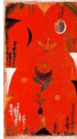
الشكل (5) بول كلي - اسطورة زهرة - ألوان زيتية - 1918

" لقد وجد بول كلي في هذه المدينة ينبوعه الرئيسي... لقد رأى.... المساحات اللونية والأشكال المبسطة... والرموز.... وكأنها جميعها أشياء كان يبحث عنها" (اسماعيل، صدقي، 2011، صفحة 123). مستتيراً بفلسفته الروحية الخيالية كما في الشكل (5) حيث تتسجم الخطوط والإيقاعات اللونية بالبعد الروحي الصافي المستمد من الفن البدائي.