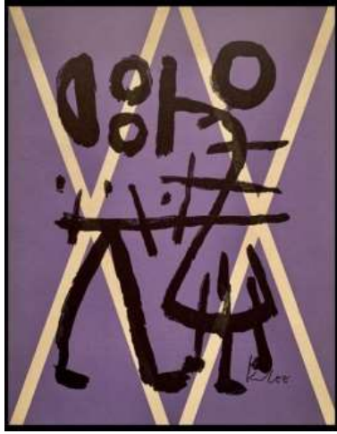
الشكل (16) بول كلي- ليتوغراف-1952-24.3/31.6سم

كاننا أمام لوحة فنية مليئة بالرموز والدلالات الروحية لصوره وعوالمه الخيالية بحسبها الطفولي الفطري، قائلاً: "مع الخط أنا الطفل الأبدي" (schiele، 1988، صفحة 6) قائلاً: "دعونا نكتفي بأكثر العناصر بدائية_ الخط فجر الحضارة عندما كان الرسم والكتابة الشيء نفسه، العنصر الأساسي، كقاعدة عامة يبدأ أطفالنا بها" (paul & klee، 1969، p. 103) انظر الشكل (13-15-14).