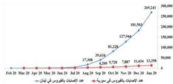
الشكل (1): عدد الإصابات بفيروس كورونا في سورية ولبنان