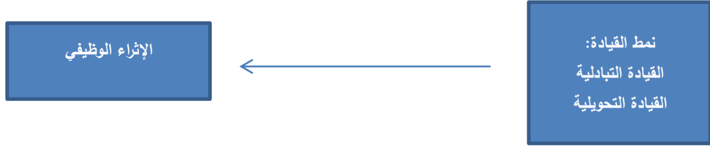
الشكل (1-1) نموذج الدراسة

يتمثل المتغير المستقل في الأنماط القيادية (نمط القيادة التبادلي، نمط القيادة التحويلي) ويتمثل المتغير التابع في الإثراء الوظيفي، كما في الشكل التالي: