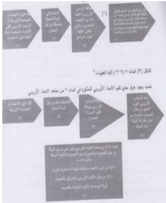
الشكل (2): المادة 7 (1) الإجراءات الوقائية التي تحدد الخطر الحقيقي لخرق قيم الاتحاد المذكورة في المادة 2 من معاهدة الاتحاد الأوروبي