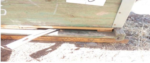
شكل 2: الطريقة التقليدية بجمع العكبر (توسيع باب الخلية بمقدار الضعف).

الشاهد (م4) : استخدمت ثلاث طوائف نحل كشاهد بدون أي تغيير للخلية ولها نفس مواصفات طوائف المعاملة.