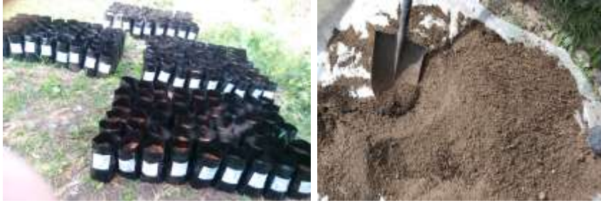
الشكل (5): تحضير الخلطات الترابية وتعبئة الأكياس وتوزيعها ضمن الخلطات

أما عمليات الخدمة بعد الزراعة فكانت عبارة عن ري بالمرش مرتين إلى ثلاث مرات أسبوعياً، تبعاً للظروف الجوية والحاجة، وتم التعشيب عند الضرورة.