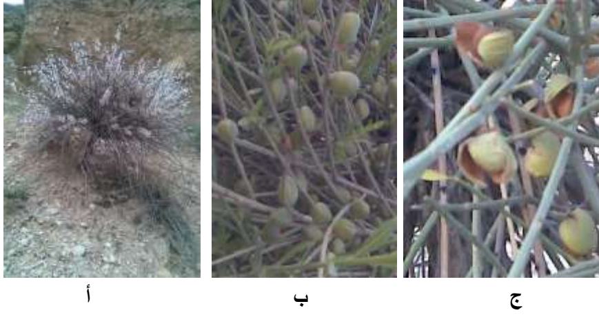
الشكل (1): اللوز الوزلي في وادي الديرية (أ- نبات مزهر، ب- نبات مثمر، ج- ثمار ناضجة).