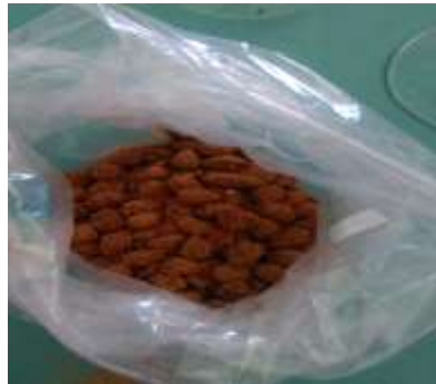
الشكل 3: تنضيد بذور اللوز الوزالي بالمدد المدروسة.