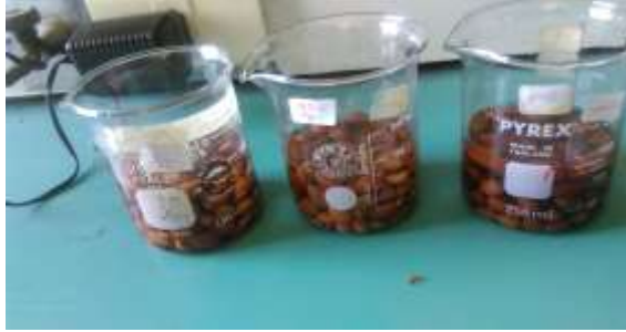
الشكل (2): نقع بذور اللوز الوزالي بالجبرلين بالتراكيز المدروسة.