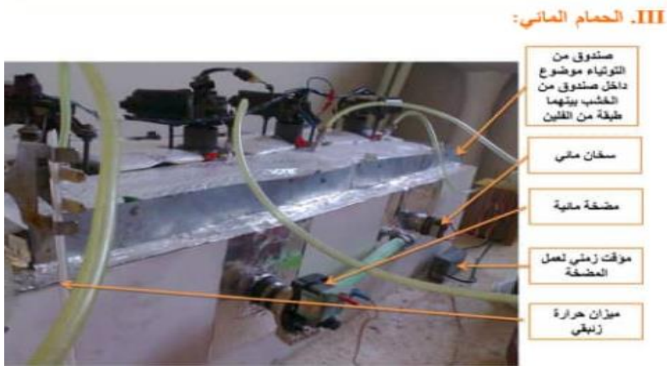
الشكل (٢) مكونات الحمام المائي