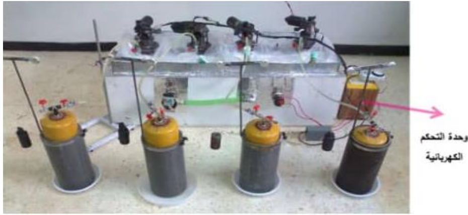
الشكل (١) وحدات إنتاج الغاز الحيوي

٥- أختبارات الهضم اللاهوائي: يحوي نخل التفاح على نسبة عالية من الكربوهيدرات، وجودها بنسبة عالية يعيق عملية التخمير، وبالتالي تم تخميرها مع مخلفات الأبقار بنسب معينة للوقوف على النسبة الأفضل لإتمام عملية التخمير دون تثبيط. أُجريت تجارب تحري إنتاج الغاز الحيوي والميثان من عينات مخلفات الأبقار غير المعالجة (الشاهد) والعينات المعالجة بإضافة نخل التفاح بنسبة ١٢.٥% ونسبة ٢٥% ونسبة ٣٧.٥% في وحدة تخمير لاهوائية تجريبية مصنعة محلياً في مخبر الطاقات المتجددة في كلية الزراعة الثانية (الشكلان ١ و ٢)، ضمن درجة حرارة المخبر لمدة ٤٢ يوماً، جرى تحريك العينات داخل كل هاضم مدة عشر دقائق كل ثلاثين دقيقة وفقاً لـ VDI 4630 (٢٠٠٦) وتم أخذ قراءات حجم الغاز الحيوي المنطلق بشكل يومي. تمت اختبارات الهضم اللاهوائي لقياس الميثان الكامن في العينات بحسب VDI 4630 (2006 و DIN 51900 (٢٠٠٠).